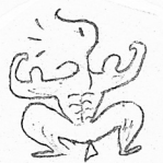
マッチョ ウッドストック